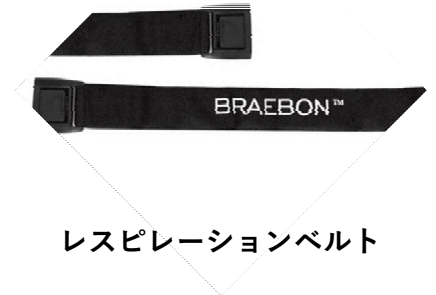
レスピレーションベルト