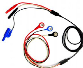
シールド付きリード線