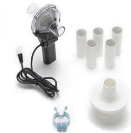
スパイロメーターキット