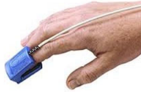
パルスオキシメーター