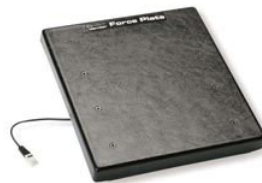
フォースプレート