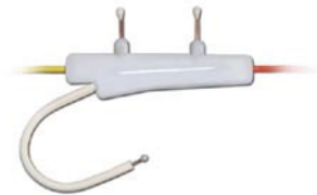
ネーザル/オーラルセンサー