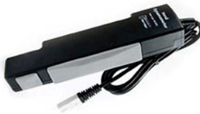
グリップフォース