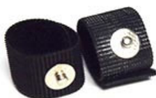
GSR (皮膚発汗) キット